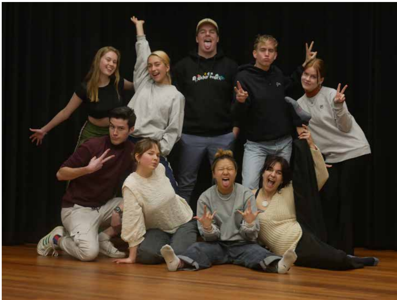
GAST jongeren 2022