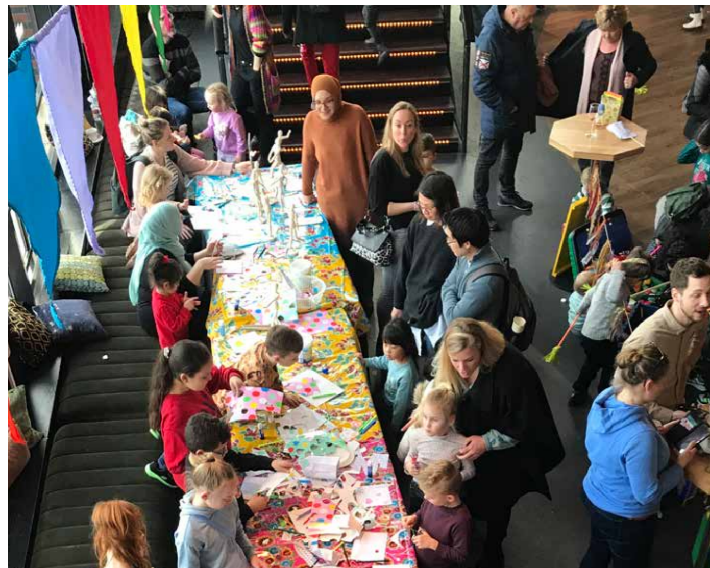
Het Grote Avonturenfeest 2021

Tot slot nog een mooi voorbeeld van een bijzondere alliantie. Het Zaantheater is partner van het Netwerk Café . Dit is een (bijna) maandelijksse bijeenkomst voor 50-plussers die een baan zoeken. Zij volgen gratis inspiratiesessies en workshops om beter beslagen ten ijs op de arbeidsmarkt te komen. Hele nuttige bijeenkomsten waar we graag aan meewerken.